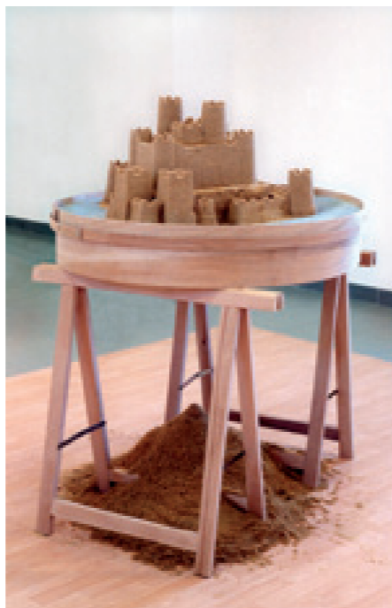
L'état de sable Mars 2004, sculpture, sable, tamis, tréteaux, 95 x 140 cm