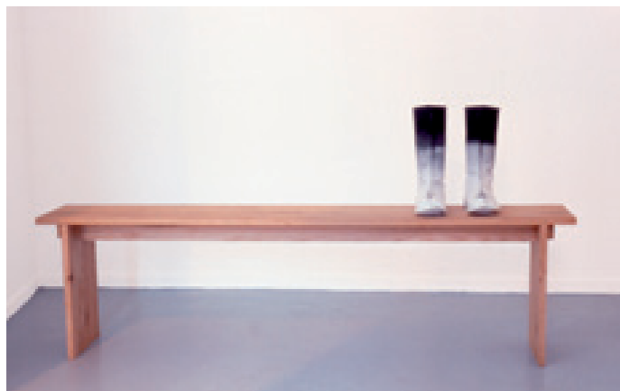
Conte d'hiver 2001, feutre gris, sel, banc en chêne, 185 x 90 x 30 cm